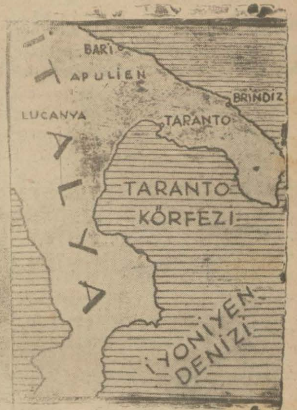
İtalyanlara son darbeyi vuran İngiliz donanması